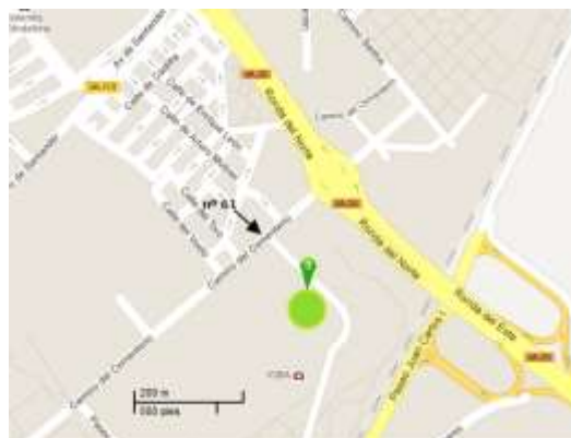
Mapa de Localización