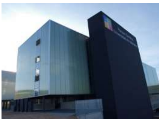
Centro de Transferencia de Tecnologías Aplicadas (CTTA)