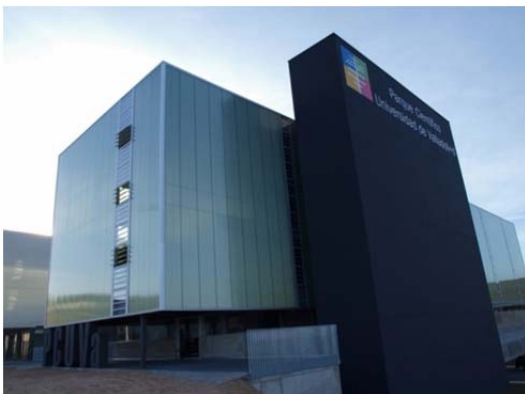
Centro de Transferencia de Tecnologías Aplicadas (CTTA)