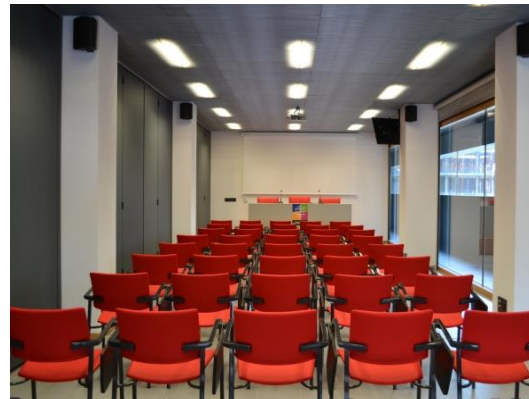
Salón de Actos