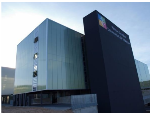
Centro de Transferencia de Tecnologías Aplicadas (CTTA)